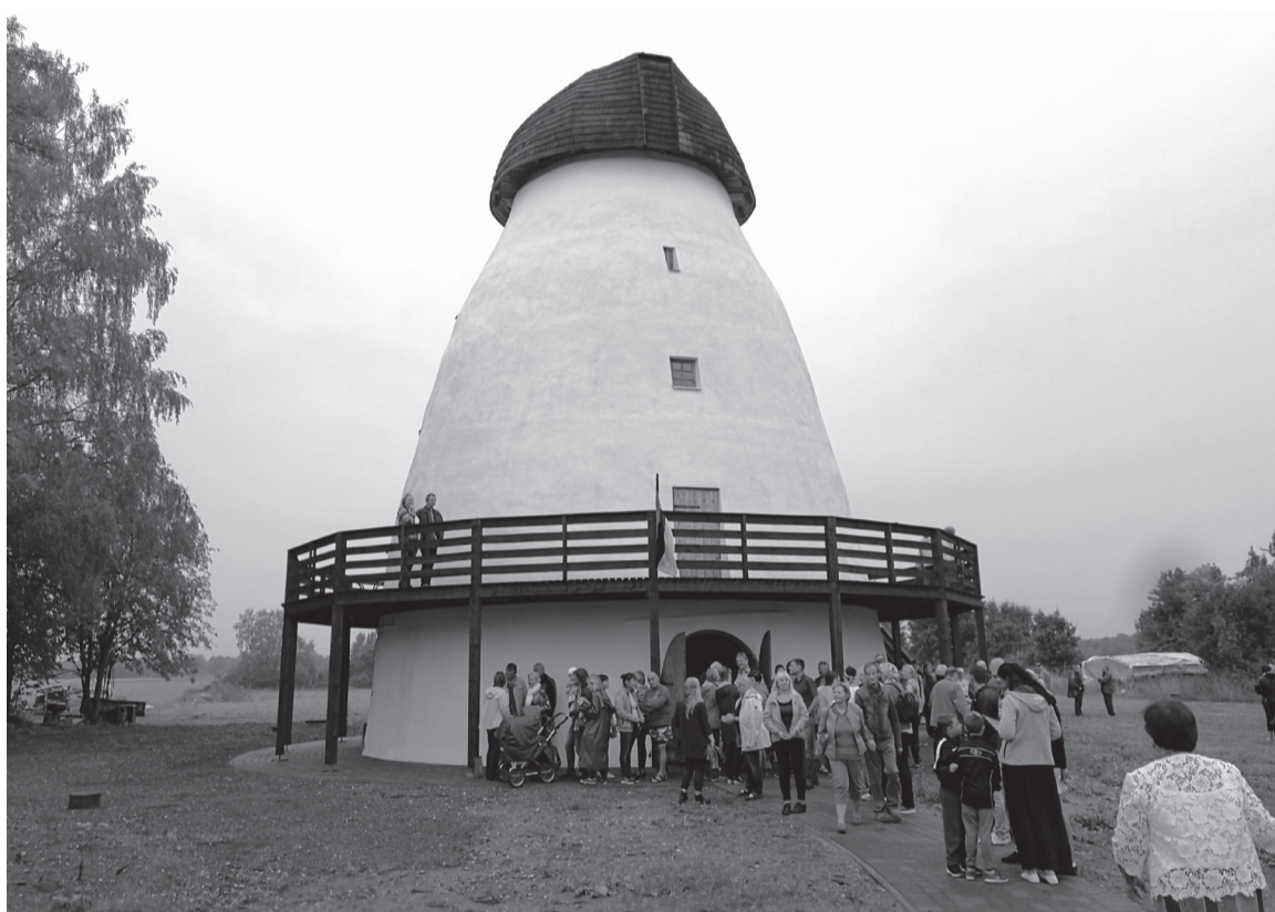
Suistle tuuleveske vallategemisele olli tullu rahvast nii oma kandist ku kaugembelt. Kik tahtsive sedä suurt uhket veskeoonet siistpuult kah kaia.

20. augustil 2018 olli veske vallategemise pidu. Kohale olli tullu nõnda pallu inimesi, et kik es tahta summagi veskese ärä mahtude. Sedäviisi and rahvas au vanale veskele ja temä noorele akkajele peremihele.