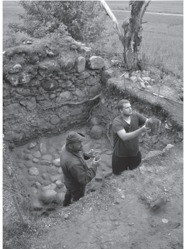
Kiriku mõrdist põrmand olli tettu suurde kivide pääle.

sist akne, ehitedi ennembise ohverdemisekotusse pääle mitte ildamb ku neil aastil. Ohvrerahade kõrvan ollive väikse ehituse, arvate om, et puust kabeli, palanu jäänusse. Söepuru ja tukke alt ja siist es tule vällä üttegi münti. Uune lõhkemisest tekkunu päälmise rämpsukihi sihen olli kah uvvembit rahasit, 1570. ja 1660. aastide vahel lüüdu killingit.