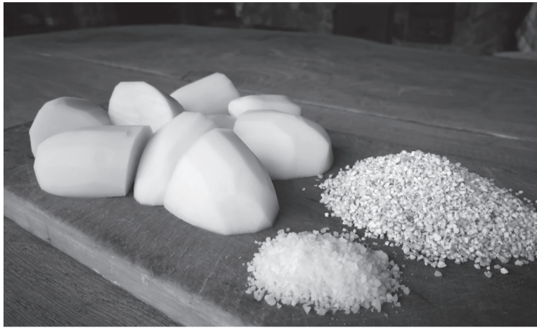
Mulgi pudru jaos om vaja suurmit, kardulit ja suula.

Mes vahe om tangul ja ruubil? Prilla om kige ariligumbe kesväsurme. Jämme suurme ek ruubi om koorest puhtas lihvitut terve villäterä. Purus tettu ruubi om tangu ek peenikse suurme. Nüüdsel aal om puuten päämiselt peenike tang,