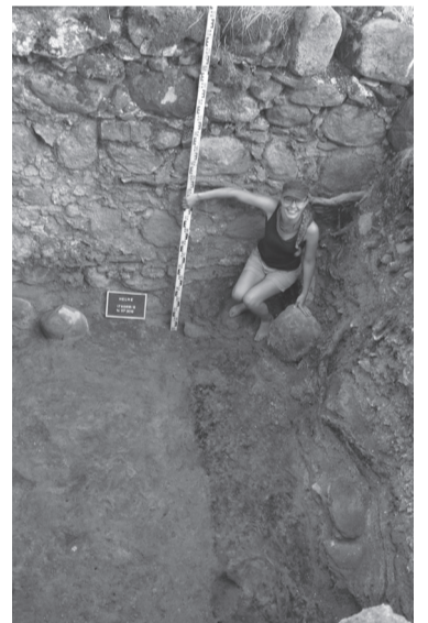
Keskaigse kiriku alt tulli vällä ohvremüntege maapind ja palanu ehituse jäänusse.