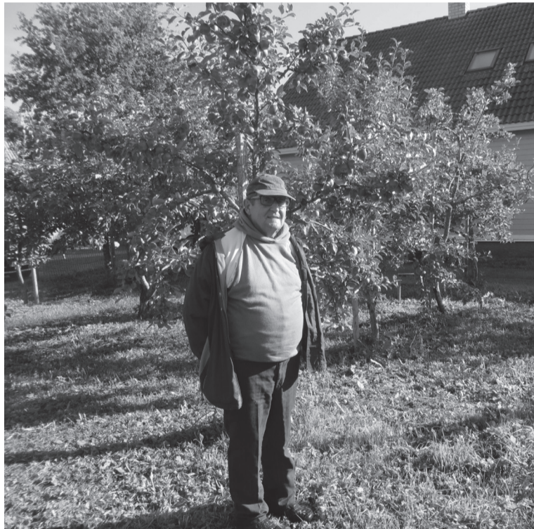
Kuigi suvi olli kuju, om mõni ubinepuu peremihe rõõmus saagi all peris loogan.