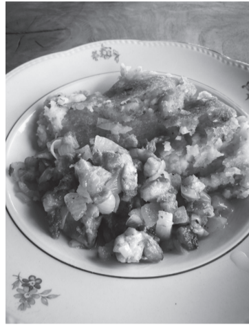
Küdsätet Mulgi puder lihatükiksidge.

Mulgi korp om sedäsisamate aage muutunu. Näituses korbi tegemine tuure taina pääl om kaunis uus komme. Vanast panti korbi täädus enne küdsätet ja pooles lõigat pätsiku või saiakanniku pääl.