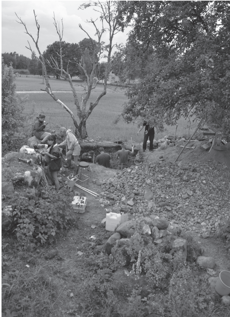
Välläkajumise juulikuul Elme väikse kiriku kotusse pääl.

Kajumise tei rasses paks kiht rususit, mes ollive tekunu sis, ku kiriku müüre ja tellisest võlve lõhuti. Kivipuru, mõrditükke ja tellisepuru alt tulli vällä keskaigse kiriku mõrdist tettu põrmand, mes olli laotu savige seot suurdest kividest alusse pääle. Ligi kate miitre sügävusen tulli vastu kiriku ehitamise aigne maapind. Endisaigse luodusliku alli mulla ülemisen jaon olli pallu väiksit õhuksit ütelt puult lüüdu 13.-14. aastesaa rahasit – enämbiste Tartu, Talna ja Põhja-Saksamaa penne. Nende man olli tillike kõllane elmes – siandsit kandsive tol aal eesti naise. Raha ohverdemine om pääle akanu 13. aastesaa keskpaiku, 1360. aastidest uvvembit münte kivikiriku ehitusrämpsus all es ole. Sii näitap, et kirik, millel olli mõrdist põrmand ja laa-